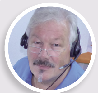
Harald Klein Konzepte & Recherche